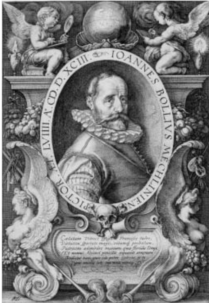
HENDRICK GOLTZIUS 1558-1617

Portret van Hans Bol op 59-jarige leeftijd, 1593 Portrait of Hans Bol aged 59, 1593 gravure/engraving, 26,5 x 18,3 cm Inv. BdH 9799 (Coll. Bierens de Haan)